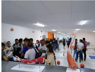
Figura 01: Alunos da rede estadual de ensino conhecendo partes do corpo humano, Caruaru-PE