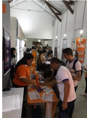
Figura 02: Recepção dos alunos na estrada do evento.